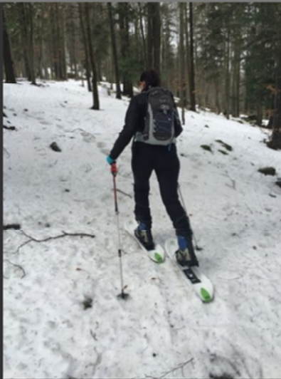
Der Halt im Aufstieg ist perfekt...

In der Region sind die Hänge für die Crossblades absolut geeignet – im Gebirge dürfte es weniger Spass machen. Crossblades sind eine Alternative zu